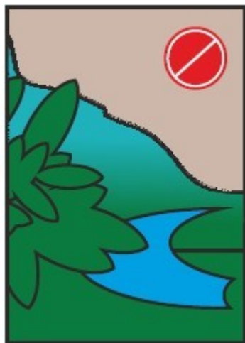
pictogramme de balisage des chemins 12x17cm